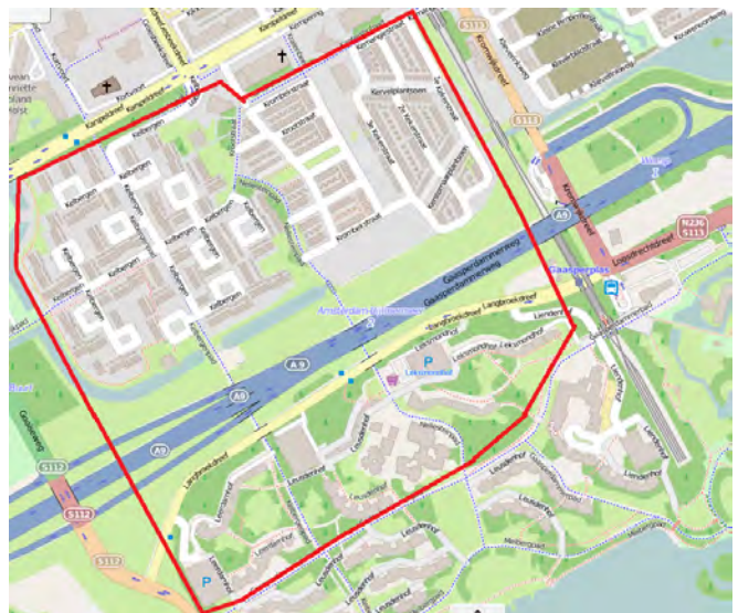
Afbeelding: binnen de rode lijnen wordt dit bouwbericht bezorgd.

U krijgt deze bouwberichten over de werkzaamheden in uw directe woonomgeving in de brievenbus. Wilt u goed op de hoogte blijven van alle werkzaamheden die IXAS aan en rondom de A9 verricht? Abonneer u op het digitale voortgangsbericht. Dit kan door een e-mail te sturen met uw naam, adres en e-mailadres naar communicatie@ixas.nl .