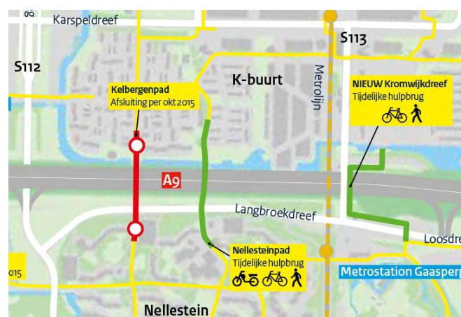
Afbeelding: de oversteekmogelijkheden voor fietsers en voetgangers vanaf maandag 5 oktober