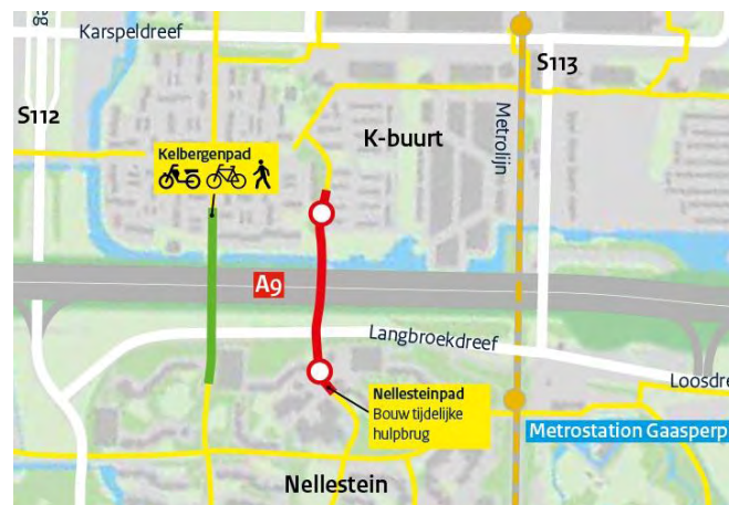
Afbeelding: de oversteekmogelijkheden voor fietsers en voetgangers van maandag 10 augustus tot en met vrijdag 2 oktober

Tijdens de bouw van de hulpbrug is het Nellesteinpad dicht: van maandag 10 augustus tot en met vrijdag 2 oktober. Het Kelbergenpad is in deze periode open. Zo kunt u toch de A9 kruisen. Op maandag 5 oktober wordt het Kelbergenpad afgesloten. Dit blijft zo tot het einde van het project in 2021. Het Nellesteinpad is dan weer open. Op 5 oktober opent ook een nieuwe oversteekmogelijkheid voor fietsers en voetgangers bij de Kromwijkdreef. Op bijgaande grote afbeelding ziet u ook voor de rest van de A9 welke fietspaden open blijven en dicht gaan.