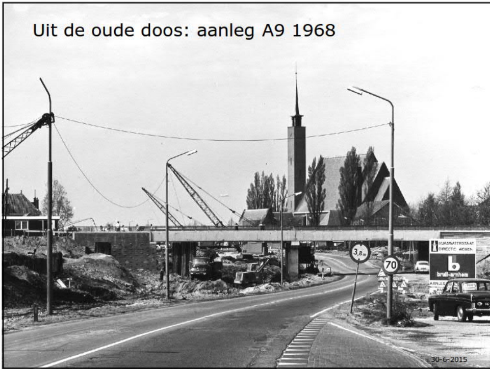
Uit de oude doos: aanleg A9 1968