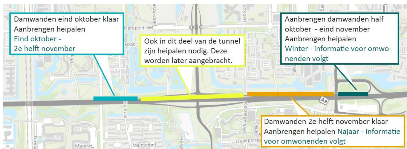
Afbeelding: de globale planning van het aanbrengen van de heipalen.

In november start IXAS met de bemaling. De bemaling zorgt ervoor dat de grondwaterstand wordt verlaagd. Dit is nodig omdat delen van de tunnel onder de huidige grondwaterstand gemaakt moeten worden.