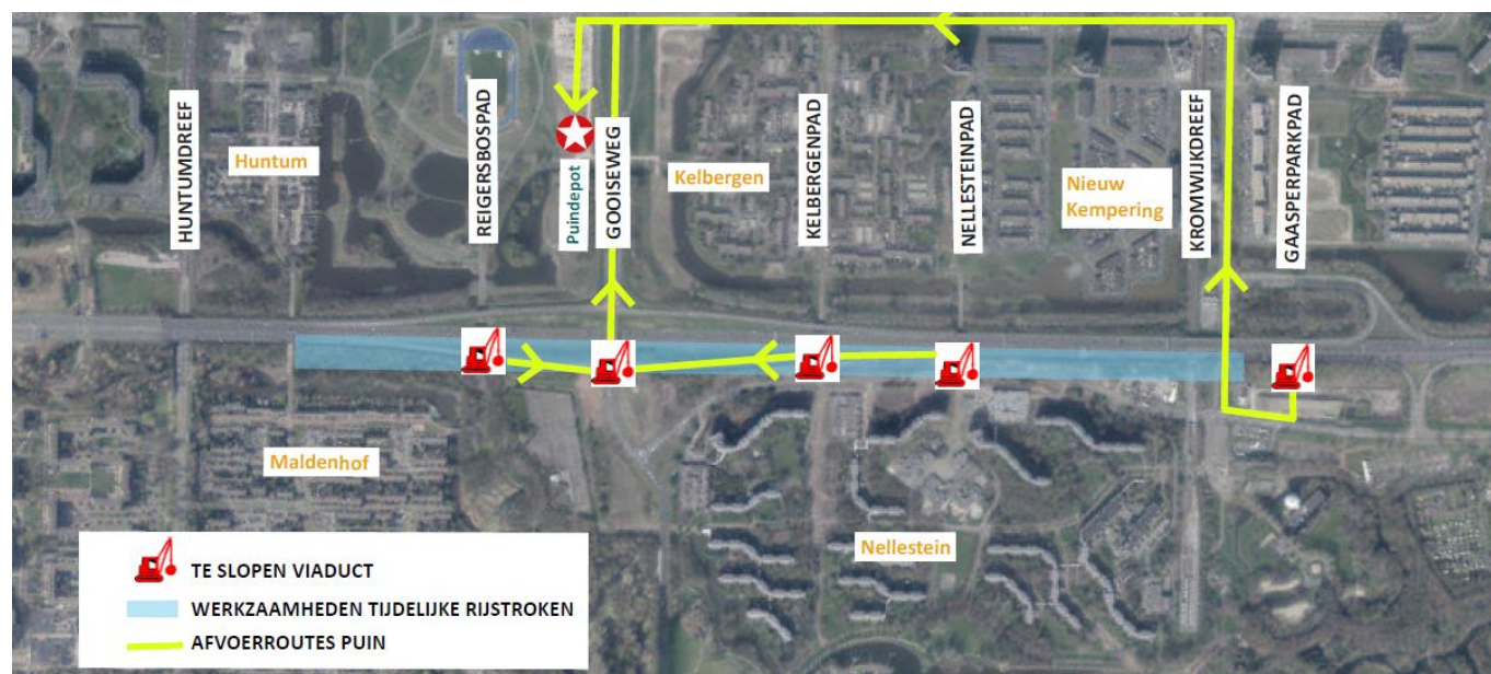
Afbeelding: de werkzaamheden die tijdens het sloopweekend uitgevoerd worden.

Van vrijdagavond 27 november 22.00 uur tot maandagochtend 30 november 5.00 uur leggen we de tijdelijke rijstroken aan de zuidzijde van de A9 aan. Deze zijn nodig voor het snelwegverkeer tijdens de bouw van de tunnel. Op de plekken waar de viaducten gesloopt zijn brengen we puin en zand aan als ondergrond voor de rijstroken. Deze ondergrond wordt met een trilwals verstevigd. Over het gehele tracé brengen we asfalt en belijning aan en plaatsen we verlichting en matrixborden. Het grootste deel van de werkzaamheden vinden plaats achter de al geplaatste geluidsschermen: aan de zijde van de snelweg.