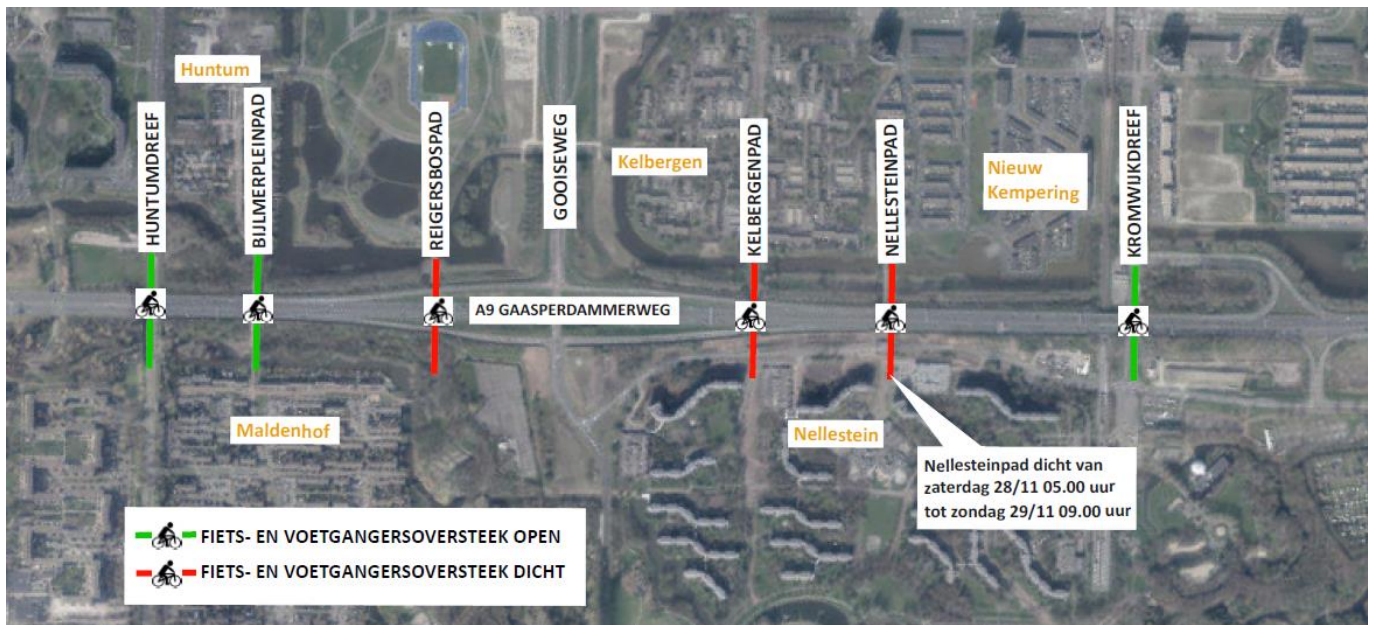
Afbeelding: de plekken waar fietsers en voetgangers de A9 over kunnen steken tijdens het sloopweekend.