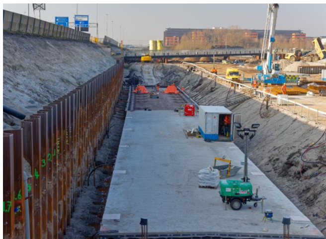
Figuur 2: Bouw wisselbaan

voor alle verkeer. De rijbanen richting Holendrecht zijn in het tweede weekend van vrijdag 8 tot en met maandag 11 april aan de beurt. Ook dan is de A9 afgesloten voor alle verkeer, maar ditmaal in de rijrichting Holendrecht. Kijk op het Online Bezoekerscentrum van Rijkswaterstaat voor de omleidingsroutes.