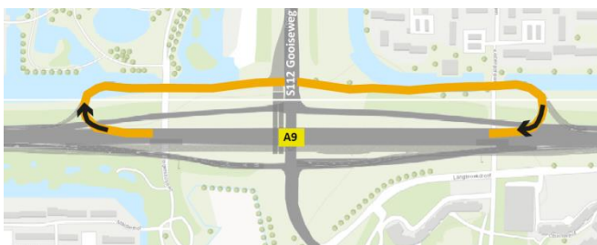
Afbeeldingen: na november 2016 komt de afrit S112 pas na de oprit S112.