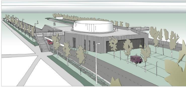
Afbeelding: impressie van het dienstgebouw op de Gooiseweg. Het grootste van de drie dienstgebouwen.