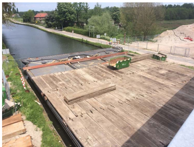
Figuur 2: Sloop oude brug boven rivier de Gaasp

Zodra de oude brug is gesloopt, gaan we verder met de bouw van de nieuwe noordelijke brug. Medio augustus informeren wij u verder over deze werkzaamheden