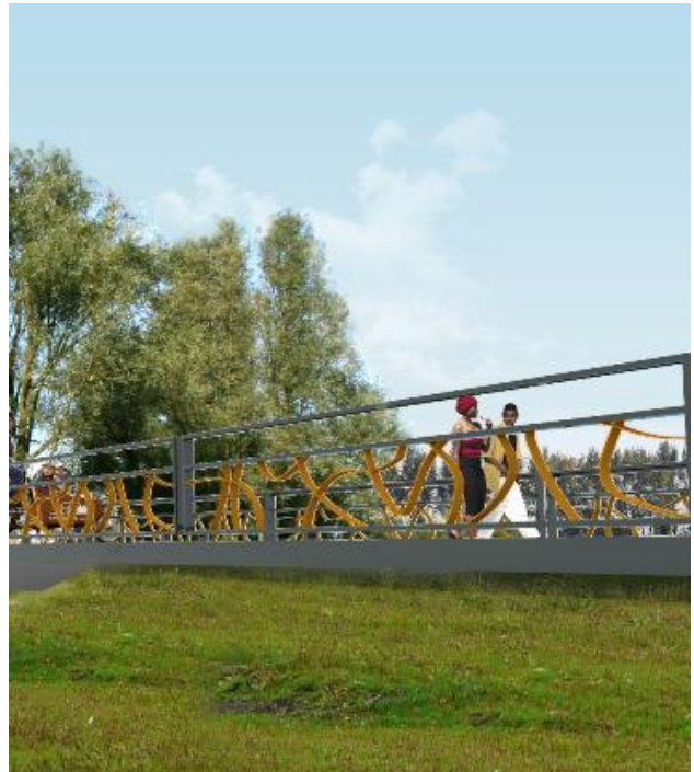
Afbeelding: een impressie van de toekomstige fietsbrug tussen het tunnelpark en het Nelson Mandelapark.

De werkzaamheden worden van maandag tot en met vrijdag van 7.00 – 19.00 uur uitgevoerd. Soms werken we ook op zaterdag. Omdat het depot het wandelpad dat langs de wijk Huntum naar de Vlinderheuvel loopt kruist, is dit pad vanaf 17 augustus tot het einde van het project afgesloten. Grondwerkzaamheden geven meestal weinig geluidshinder. Wel kunt u tijdens het verwijderen van het groen de kettingzaag horen. IXAS bereikt de locatie van de werkzaamheden vanaf de bouwweg die naast de oprit S112 Gooiseweg ligt.