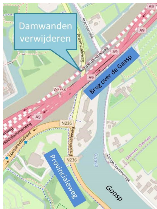
Afbeelding 1 Locatie damwandwerkzaamheden 14 t/m 17 november

Tijdens de werkzaamheden wordt één rijbaan afgesloten voor het gemotoriseerd verkeer. Dit verkeer wordt dan met kortdurende verkeersstop geregeld.