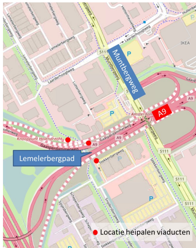
Afbeelding 1: locatie heipalen voor uitbreiding viaducten

Als de palen zijn aangebracht bouwen we de betonnen landhoofden op. Half april zijn ze klaar en hijsen we de liggers voor het wegdek in. Om ervoor te zorgen dat het nieuwe wegdek goed aansluit op het bestaande dek, verwijderen we begin april de randen en de geleiderail van de bestaande viaducten en boren we gaten voor verbindingstaven. Tijdens deze werkzaamheden blijft het fietspad open. Verkeersregelaars zorgen ervoor dat het verkeer veilig langs de werkzaamheden kan rijden.