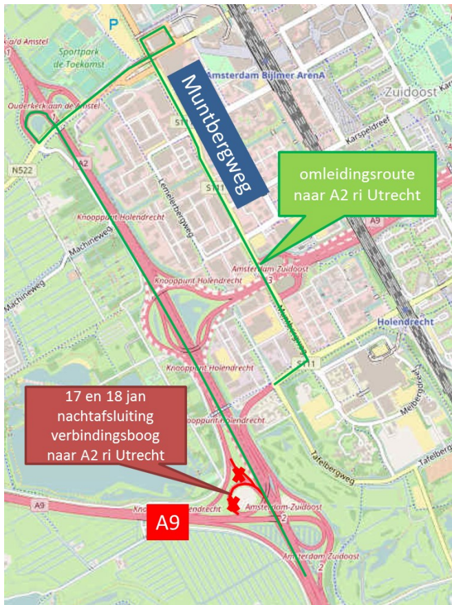
Afbeelding 2: afsluitingen en omleiding 17 en 18 januari van 22:00 tot 5:00 uur

IXAS start in februari met de bouw van een nieuw viaduct bij het zuidelijke deel van knooppunt Holendrecht (zie afbeelding 2). Om het bouwverkeer veilig op de bouwplaats te krijgen, bouwen we hier een speciale bouwwinrit. We doen dit op 17 en 18 januari tussen 23:00 en 5:00 uur. Het werk, zoals stralen en het verwijderen van geleiderail, kan zorgen voor geluidsoverlast. Om het werk uit te kunnen voeren zijn de verbindingsboog naar de A2 richting Utrecht en de aansluitende parallelrijbaan beide nachten afgesloten voor het verkeer. Het verkeer kan via de S111 Muntberg en de oprit Ouderkerker aan de Amstel naar de A2 richting Utrecht. De route wordt met gele borden aangegeven.