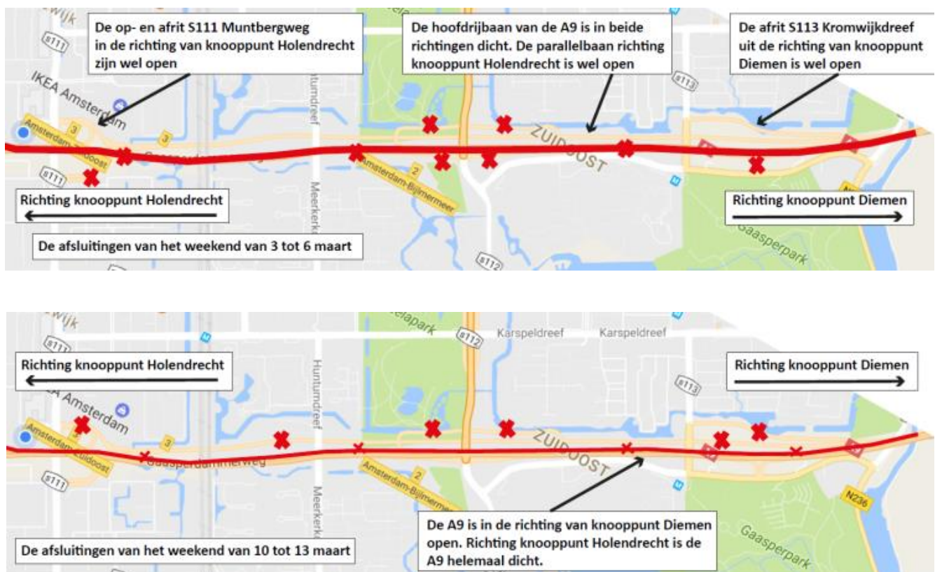
Afbeelding 2: Afsluitingen A9 Gaasperdammerweg 3 – 6 en 10 – 13 maart

Deze werkzaamheden voeren we uit tussen 13 maart en 7 april van maandag tot en met vrijdag. In deze periode werken we ook 's avonds en 's nachts tussen 20:00 en 6:00 uur. We passen dan ter hoogte van de A9 de verkeerssituatie op de Muntbergweg aan. In beide richtingen is één rijstrook voor het verkeer beschikbaar. Tussen 6:00 en 20:00 zijn er in beide richtingen 2 rijstroken beschikbaar.