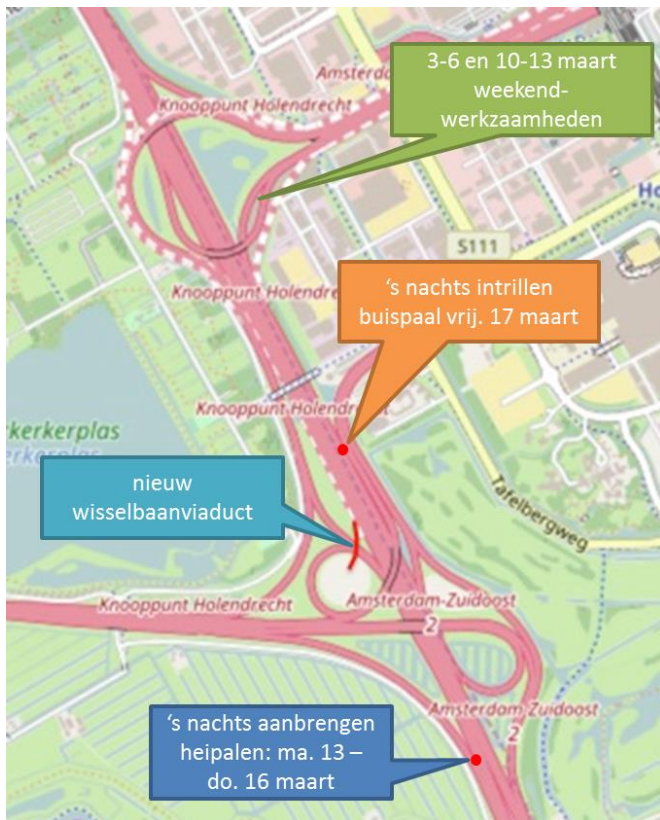
Afbeelding 2: Werklocaties

Ons buurproject A1/A6 is beide weekenden ook aan het werk. Kijk voor alle afsluitingen en omleidingsroutes op bezoekerscentrum.rijkswaterstaat.nl .