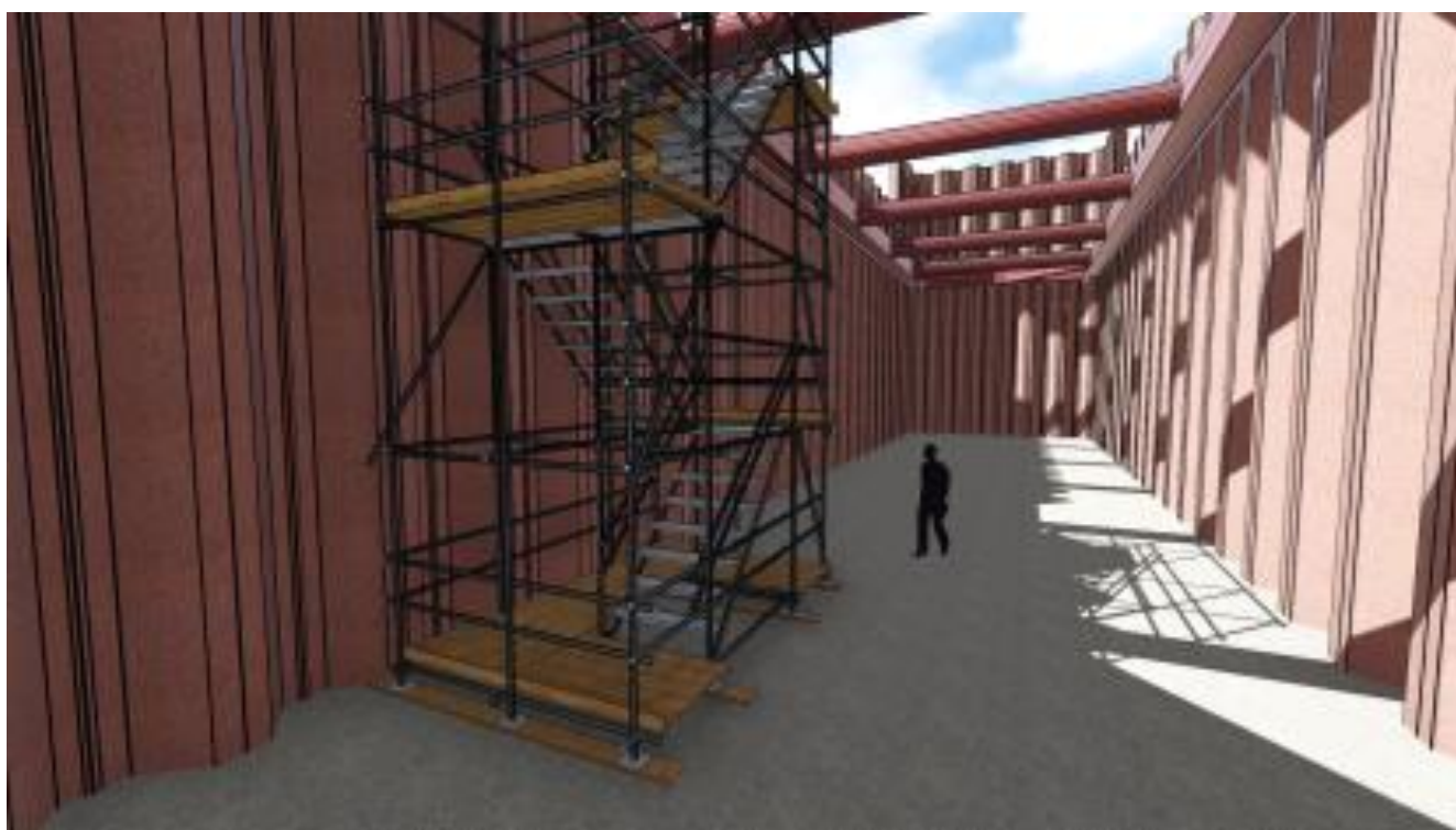
Afbeelding: het wordt een forse waterkelder van 34 meter lang, 7 breed en 10 meter hoog.

Na het aanbrengen van de damwanden volgt de rest van de bouw van de waterkelder. Deze werkzaamheden geven weinig hinder. Naar verwachting is de waterkelder aan het eind van dit jaar klaar. Wilt u meer weten over de functie van de twee waterkelders? Kijk dan op onlinebezoekerscentrum.rijkswaterstaat.nl .