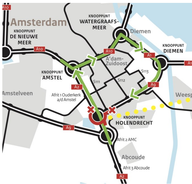
Afbeelding 3: omleidingsroutes 30 juni 22:00 uur – 3 juli 5:00 uur

Rijkswaterstaat verbreedt de A9 naar vijf rijstroken per rijrichting en een wisselstrook. De extra rijstroken zorgen ervoor dat de doorstroming verbetert, en daarmee de bereikbaarheid van de noordelijke Randstad.