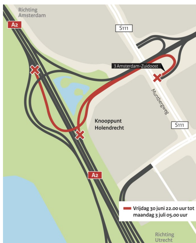
Afbeelding 2:afsluitingen 30 juni 22:00 uur – 3 juli 5:00 uur