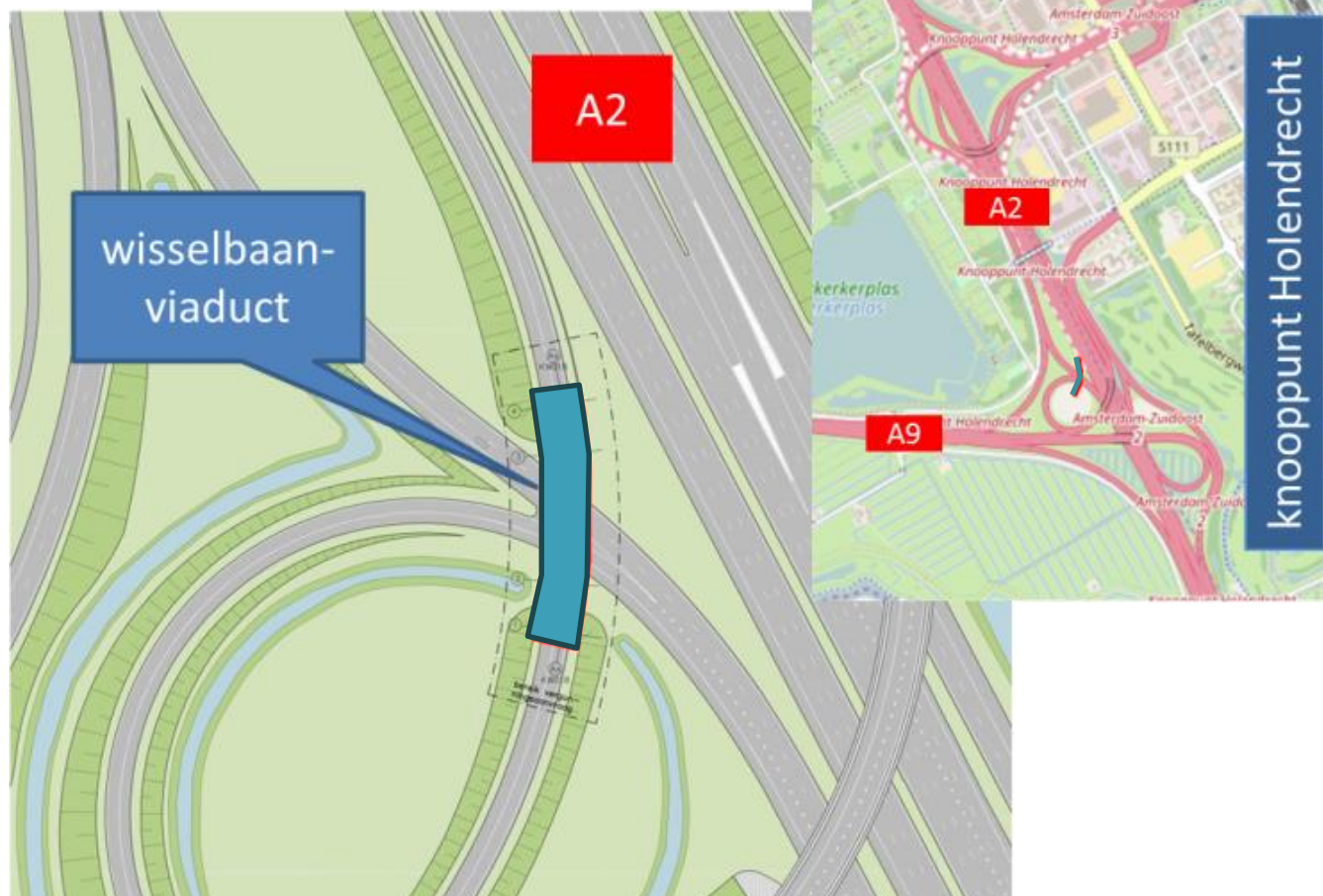
Afbeelding 1 Locatie wisselbaanviaduct

Op zaterdag en zondagnacht hijsen we de 24 liggers voor het viaduct in. De liggers komen met bijzonder