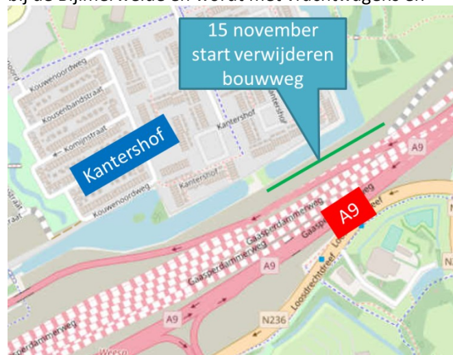
Afbeelding 1 Locatie bouwweg

De ruwbouw van de Gaasperdammertunnel is zo goed als klaar. De bouwweg tussen het Geerdinkhofpad en de Provincialeweg hebben we daarom niet meer nodig. Vanaf aanstaande woensdag, 15 november, verwijderen we de bouwweg (zie afbeelding 1). Eerst graven we de puinlaag weg en voeren die af met vrachtwagens. Vervolgens brengen we grond aan voor het talud. De grond ligt in een depot (zie afbeelding 2) bij de Bijlmerweide en wordt met vrachtwagens en