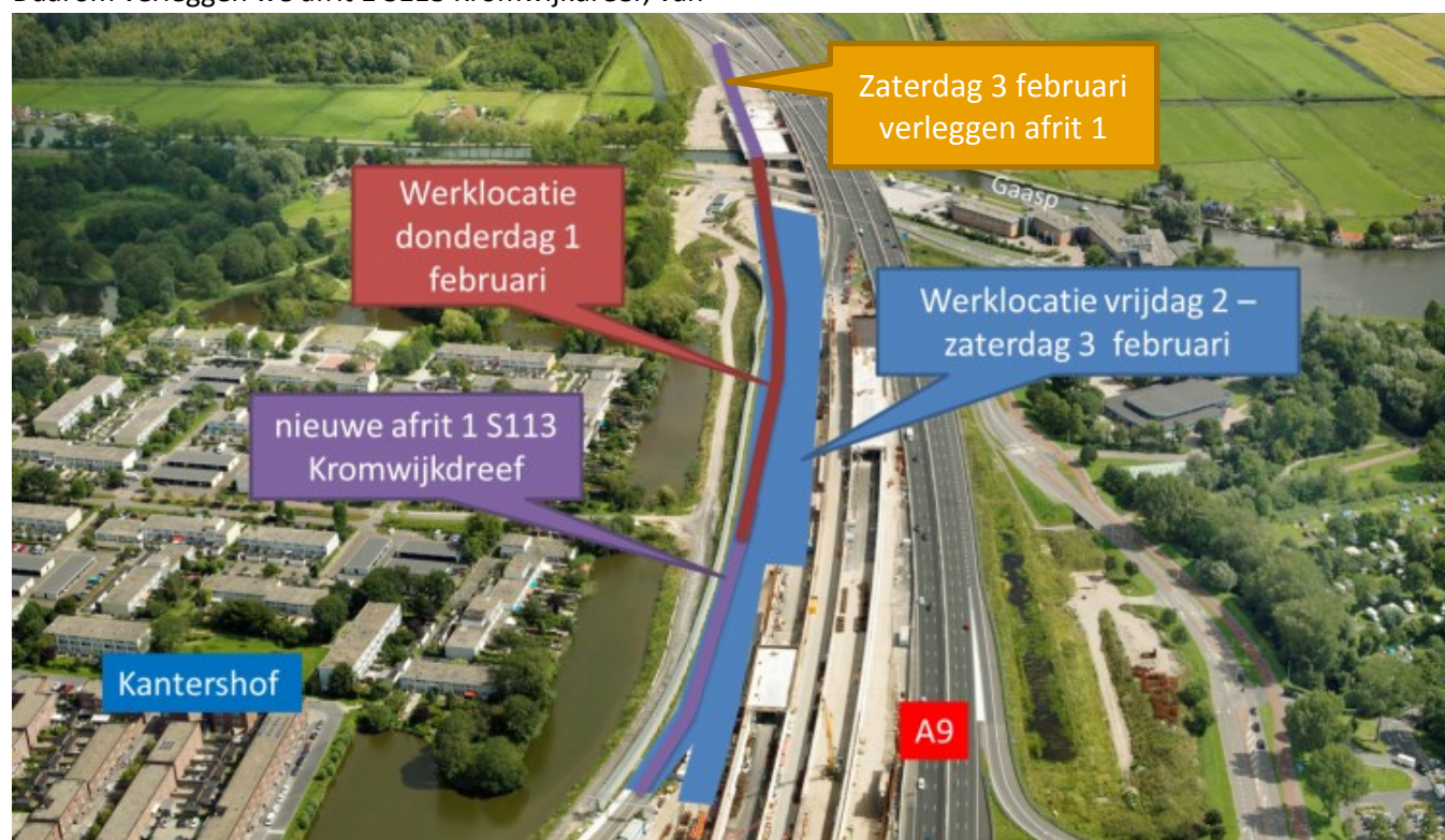
Afbeelding 1: werklocaties 1 – 3 februari (foto van augustus 2017)

Van vrijdag 2 februari 07:00 uur tot zaterdag 3 februari 10:00 uur werken we tussen de brug over de Gaasp en de inritten van de noordelijke tunnelbuizen. Hier brengen we de toplaag van het asfalt aan (zie afbeelding 1).