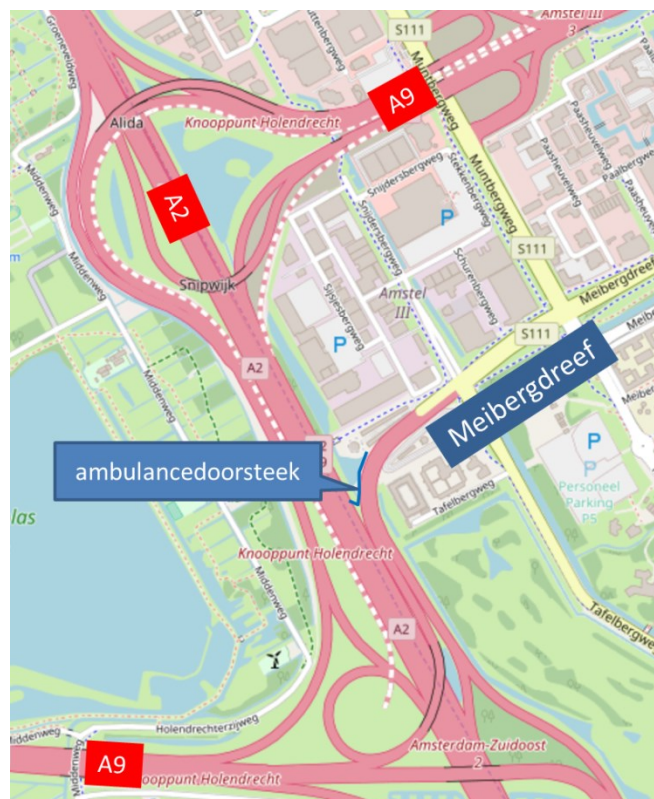
Afbeelding 1 locatie ambulancedoorsteek

Van maandag 29 januari tot en met donderdag 1 februari werken we tussen 22:00 en 05:00 uur. Op vrijdag 2 februari werken we tussen 22:00 uur en 06:00 uur. Voor de werkzaamheden is één rijstrook op de Meibergdreef afgesloten.