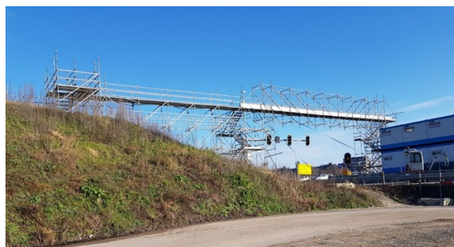
Afbelding 1 Loopbrug over afrit Gooiseweg

Aan de noordwestkant van de S112 Gooiseweg ligt een parkeerterrein voor medewerkers van IXAS. Via een loopbrug over de afrit kunnen medewerkers van het parkeerterrein naar het bouwterrein lopen. Nu de ruwbouw van de Gaasperdammertunnel klaar is, is het parkeerterrein niet meer nodig. Daarom ruimen we het parkeerterrein op en verwijderen we de loopbrug en de trappentorens (zie afbeelding 1).