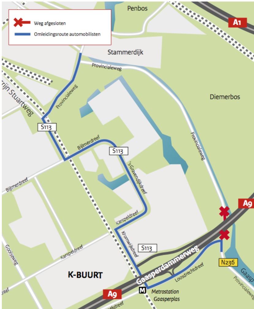
Afbeelding 2 Omleidingsroute autoverkeer 22 – 25 mei en 28 mei – 1 juni tussen 07:00 – 17:00 uur