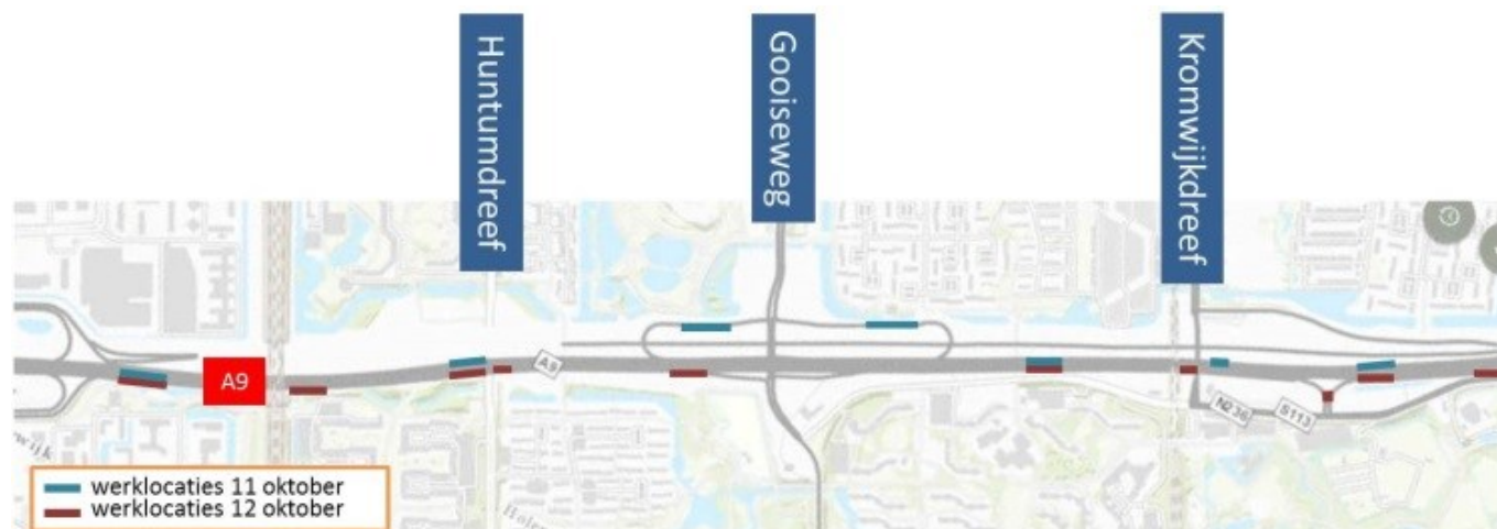
Afbeelding 1 locaties herstel asfalt en geleiderail A9