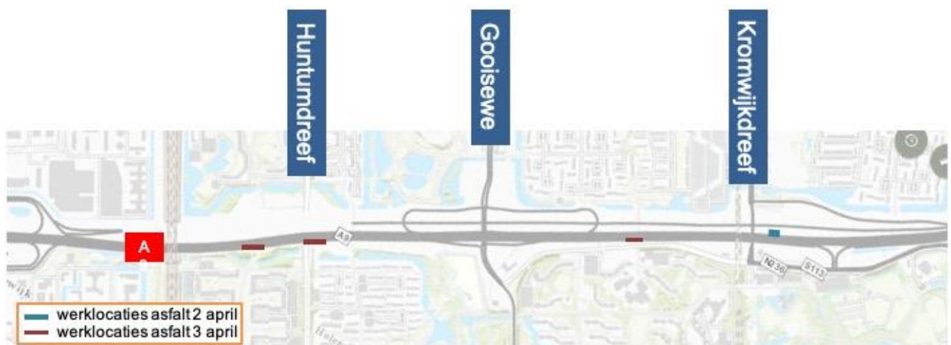
Afbeelding 1 Werklocaties 2 en 3 april