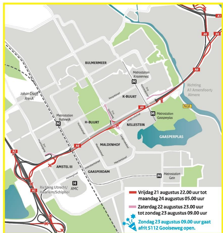
Afbeelding 3 Afsluitingen en omleidingen 21-24 augustus