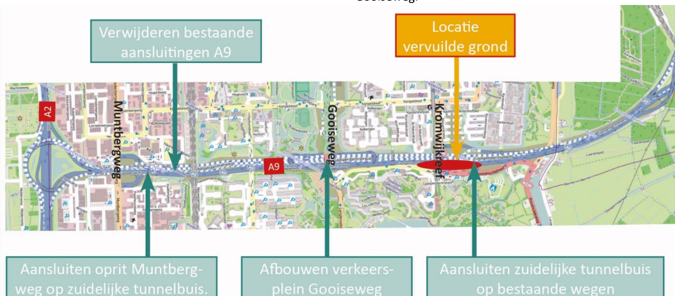
Afbeelding 1 Locaties werkzaamheden tussen 8 en 23 november

Bij de Gooiseweg bouwen we op het dak van de tunnel een verkeersplein. In het weekend van 20 tot 23 november maken we het verkeersplein af. We brengen dan ook asfalt aan op de vluchtheuvels van de kruising Langbroekdreef/ Gooiseweg.