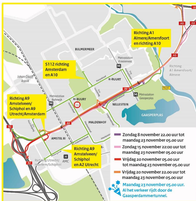
Afbeelding 2 Afsluitingen A9 tussen 8 en 23 november en omleidingen